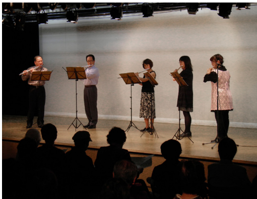
さまざまな演目が次々と (舞台発表会)