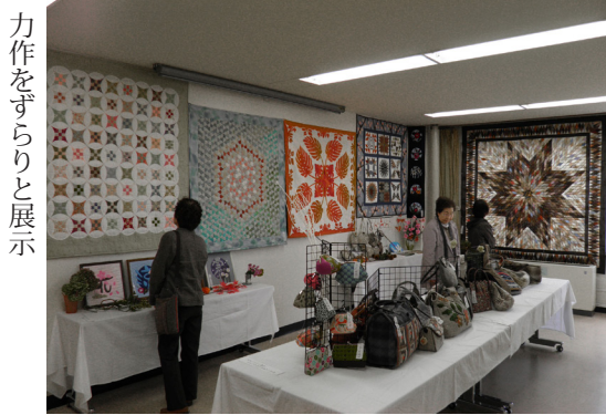
力作をずらりと展示 (作品展示会)

29日には区民ホールで舞台発表会が行われ、フルードなどの約20サークルが出演し、ステージで練習の成果を披露しました。 また、茶道サークルによるお茶席コーナーも設けられ、作品や舞台を鑑賞した後に一服する姿であふれました。 最終日には区民ホールでコーラスの集いが開催され、女声コーラスや混声合唱サークルが舞台上で歌声を披露。来場者は調和のとれたハーモニーにうっとり聞きほれていました。