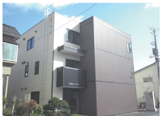
八軒サービスハウス外観