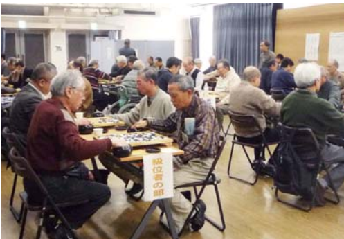
碁盤に集中する参加者