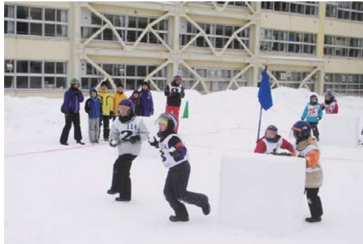
冬ならではのスポーツです

「開拓杯争奪ふれあい雪合戦大会」開く 雪合戦大会」が今月9日、手たちは相手選手を狙っ に、西区内の は、西区内の 小学校から低 学年2チーム、 高学年5チー ムが出場しま した。 当日会場に は2面のコー トを用意。選