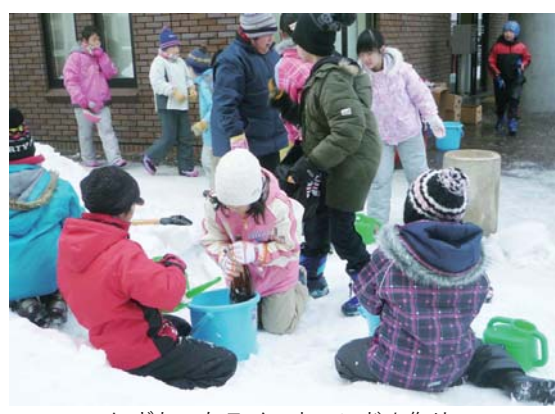
にぎわったスノーキャンダル作り

当日子どもたちは、ス ノーキャンダルの作り方 を聞いた後、さっそく作 業を開始。バケツに雪を 詰めて水を入れ、ひっこ り返す工程を繰り返して 次々とスノーキャンダル を作製していきました。 夕方にスノーキャンダル の中のものすごく点灯 されると、会場は幻想的 な光に包まれました。