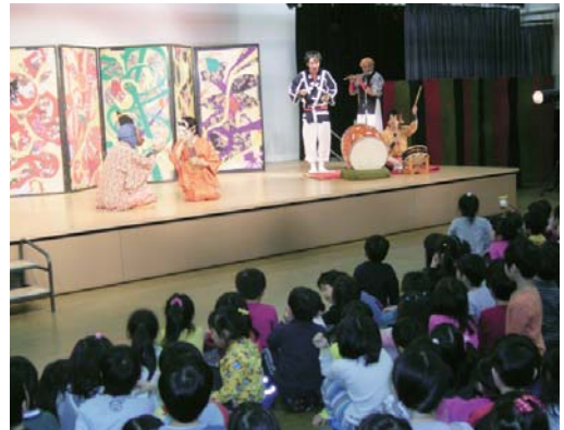
舞台に見入る子どもたち

山「農試公園」の4チームに分け、ダブルス団体戦のリーグ戦を行いました。試合は交流を重視し