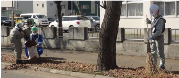
八軒西小の近辺を清掃する参加者