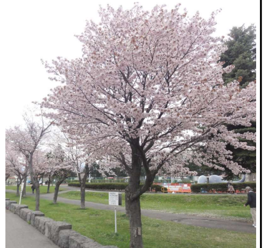
今年も美しく咲きました

札幌市では今年、4月22日に桜の開花が宣言されました。昨年より11日も早い開花宣言です。写真は4月28日に撮影したものです。見ごろには少し早くまだところどころ咲いている状態ですが、散歩をしている人が見上げていました。