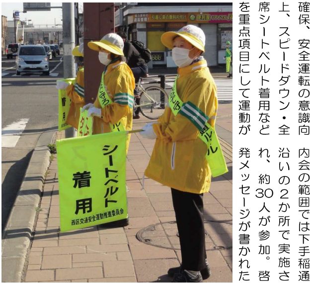
シートベルト着用を訴えました

「まちコミュ310」の配付地域でも、八軒小と八軒西小の近辺で行われました。参加者はほ