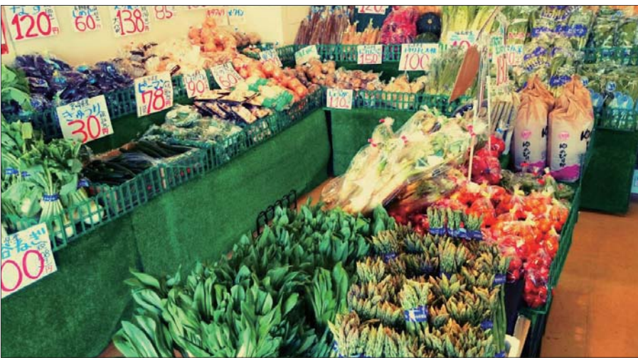
↑店内は新鮮でおいしそうな野菜がいっぱいです!

←「やっちゃんば」の由来は色々あるようですが、「やんちゃん」が一番の由来とこのことでした。