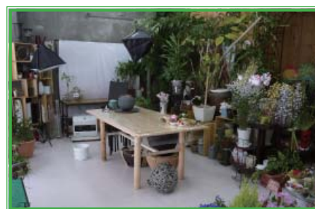
↑店内左側のリーススペース