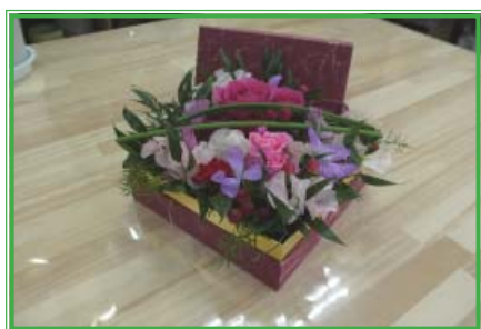
↑箱型 :6000円 花束型 :4000円 これ以外のサイズも承っております!