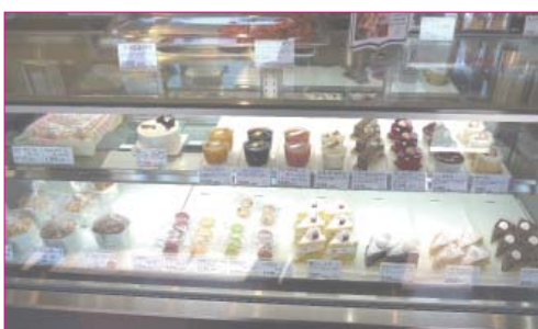
↑店内にはケーキのほか、焼き菓子も豊富です。