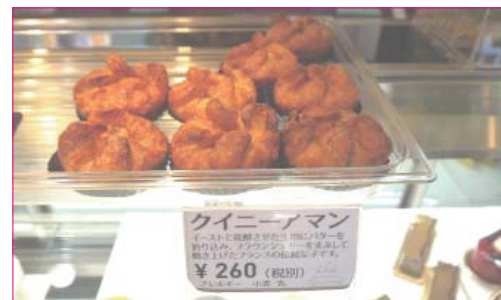
↑こだわりのクイニーアマン。通常のものとは形が違います。