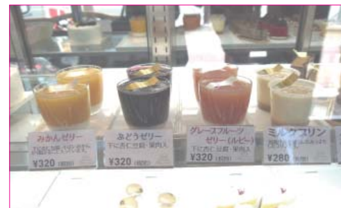
↑夏季限定のゼリー。色合いが可愛いです。