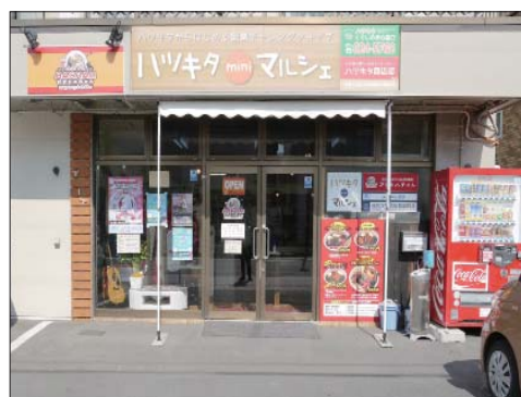
←安住ビルのむかつて一番右側です。