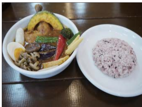
↑一番人気のチキンベジタブルカレー。13種の野菜と骨付きチキンでボリュームたっぷり。