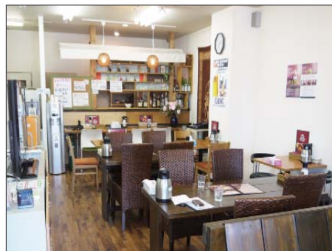
←10人ほどの宴会も対応。