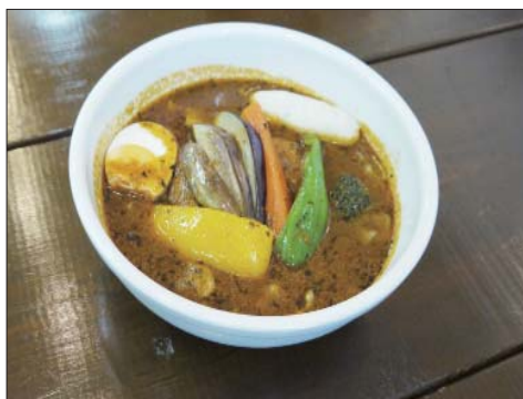
↑定番のチキンカレー。ライスの量、有り無しも選べます。