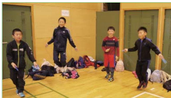
↑手を交差させて飛ぶ「あやとび」の練習