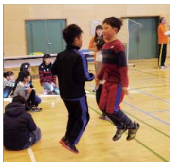
↑1本の縄を2人1組で飛ぶ「ダブルジャンプロープ」

参加した子どもたちはチームのリーダー決めなどをする中で、最初のうちは初めて話す友達と緊張の面持ち。しかし、競技が進むにつれて笑顔もみられるようになり、最終的にはチームワークの大切さも学んだようでした。優勝チームは「ラビッツ」というチームでした。本大会は来年度も開催予定ですので、冬休みの体力づくりのためにぜひ参加してみてくださいはいかがでしょうか。