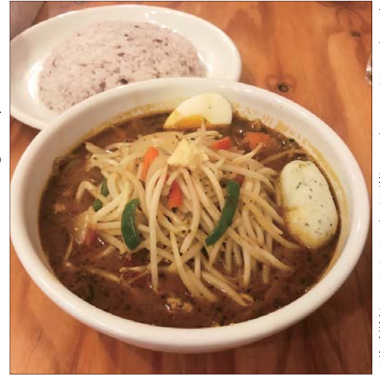
←もやしが入っている。麺が入っていても違和感なしの見た目!

アジト・ハチャム 住所：西区発寒 12 条 3 丁目 4-13 安住ビル 1F ハツキタ mini マルシェ内 TEL：011-663-8363 営業時間 11:30~25:00 (月~金) 11:30~26:00 (土曜日) 11:30~22:00 (日曜日) 夜はバーにも! 定休日：火曜日 Facebook 随時更新中! →アジトハチャムで検索!