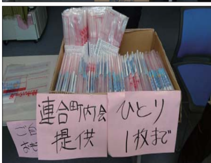
↑八軒中央会館での物資配布。