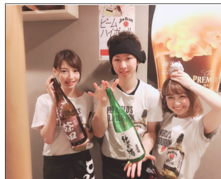
↑スタッフの皆さんが元気にお出迎え♪

オープン記念としてドリンクを290円で提供しておりましたが、大好評につきしばらくはこのままの値段で提供してくれる予定です。八軒駅エリアの居酒屋に足を運んでみてはいかがでしょうか。