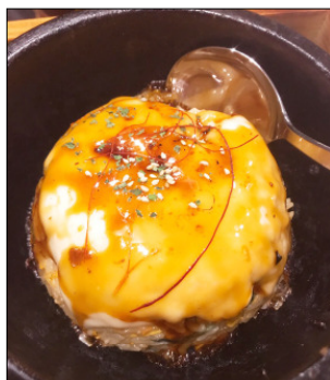
↑チーズチャーハン (税別680円)