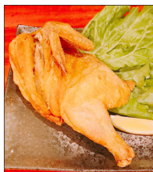
↑北海道若鶏半身揚げ (税込950円)

オープン記念としてドリンクを290円で提供しておりましたが、大好評につきしばらくはこのままの値段で提供してくれる予定です。八軒駅エリアの居酒屋に足を運んでみてはいかがでしょうか。