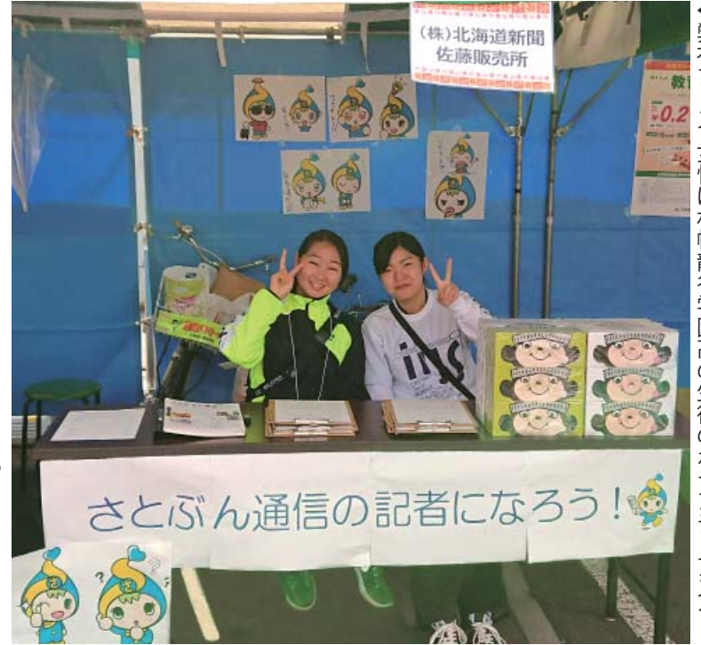
←弊社ブース。女性は札幌龍谷学園高のボランティアスタッフの方。

来年度も八軒万博は開催する予定です。次回も様々な企業ブースを体験し、また飲食も併せて楽しんでいただければと存じます。ぜひお楽しみに。