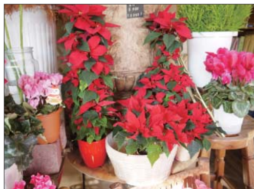
↑ポインセチア (700円~2000円)