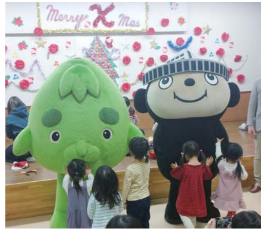
「ぶんちゃん」も登場♪

12月20日に、八軒まちづくりセンターの子育てサロン「ハニーランド」によるクリスマス会が行われ、今年も北海道新聞の公式キャラクター「ぶんちゃん」がプレゼントを持って駆けつけてくれました！登場したぶんちゃんに子どもたちは握手をしたり、抱きついたり、写真を撮ったりと短い時間でしたが楽しく触れ合っていました。その後はなんとサンタさんも登場！サンタさんとぶんちゃんからプレゼントをもらった子どもたちはとてもうれしそうでした。