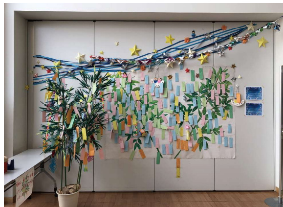
昨年は325枚もの短冊がかざられました