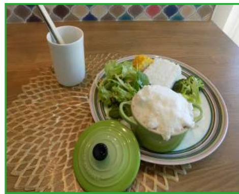
親子丼ランチプレート（980円）なんと！メレンゲの下に親子丼の具が！