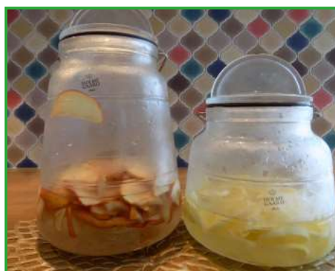
リンゴ・レモン自家製ソーダ（600円）のシロップ。リンゴはホットでも。