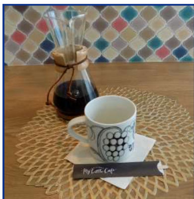
ケメックス製コーヒーメーカー