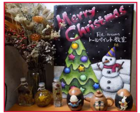
季節ごとに代わる、教室の看板 12月からはクリスマス使用に！