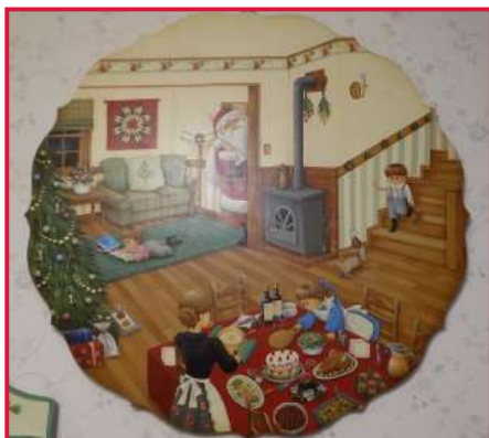
私のカントリーで受賞した作品