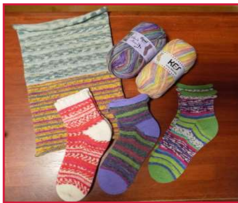
左上のスヌードは、帽子としても使えます。