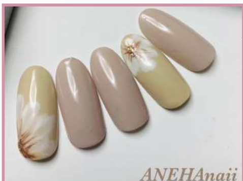
ジェルネイル(税込3,000円～) ハンドケア(税込1,500円～)