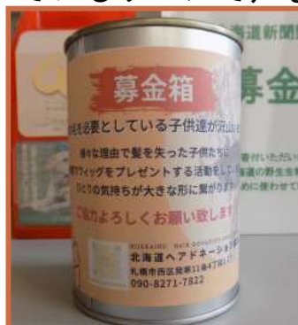
道新佐藤販売所に設置している募金箱です。是非、ご協力を!!