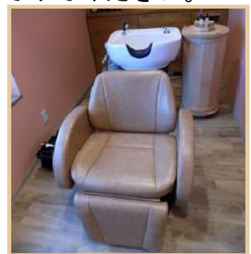
頭皮マッサージ(30分税込2,500円～)肩のマッサージも付いています。